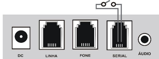
Conexão com o sensor de alarme (utilizar os pinos 1 e 2 do conector)

Caso o sensor permaneça fechado e nenhum dos cinco números da agenda atenda à ligação, haverá um intervalo de 10 minutos. Então o processo recomeça, tomando a ligar novamente para o primeiro número.